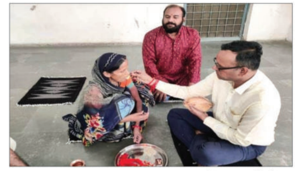
माही की गूंज, खरगोन।