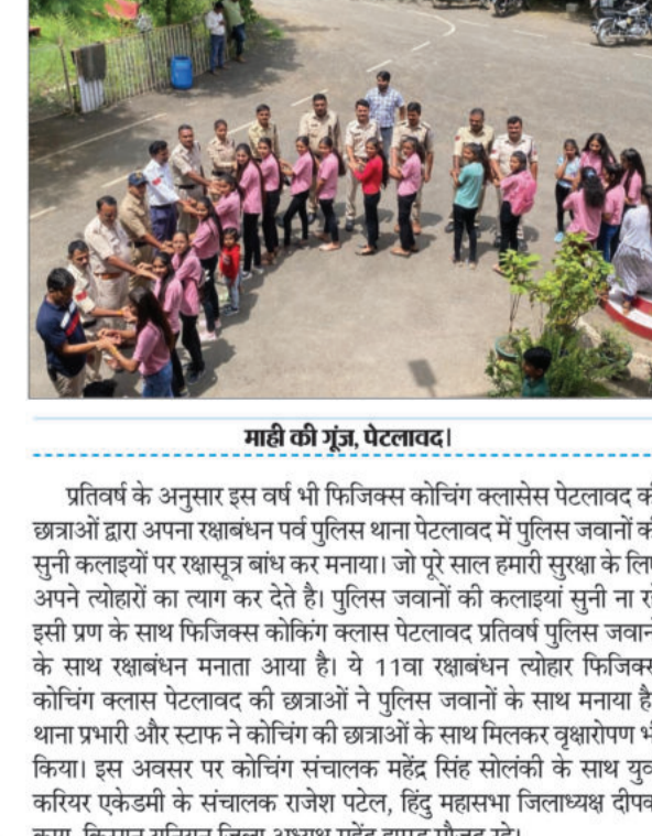
माही की गूंज, पेटलावद।