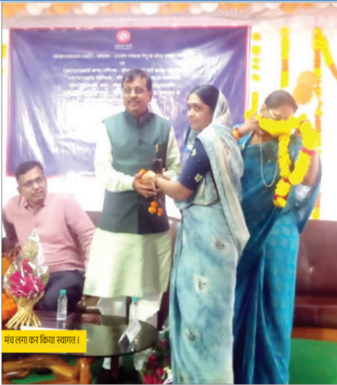
मंत्र लगा कर किया स्वागत।